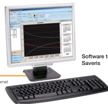
Software testo Saveris

Il software testo Saveris è dotato di un'interfaccia utente intuitiva e semplice da utilizzare. Il software Saveris è disponibile in due versioni: il modello base SBE (Small Business Edition) o il modello PROF (Professional) con diverse funzioni aggiuntive. Qualora sia necessario accedere ai valori misurati da un ambiente esterno alla locazione, è possibile impostare sul display l'accesso a Internet per tutte le misure.