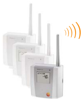
Sonda radio testo Saveris

Le sonde con sensori di umidità e temperatura interni/ esterni possono adattarsi a qualsiasi applicazione. Le sonde radio sono disponibili con o senza display, come opzione. La sonda è dotata di memoria, grazie alla quale i valori misurati non vengono persi in caso di interferenza con il collegamento radio. Le misure in corso, lo stato della batteria e la qualità del collegamento radio sono visualizzati sul display.