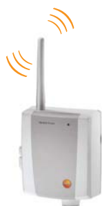
Router testo Saveris