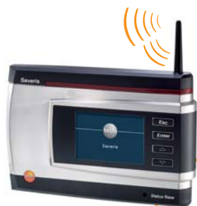
Base centrale testo Saveris

La base centrale è il cuore di testo Saveris: consente di memorizzare 40.000 letture per canale di misura, senza dipendere dal PC. Ciò corrisponde a una capacità della memoria di circa un anno, ipotizzando cicli di misura di 15 minuti. I dati del sistema e gli allarmi sono visibili sul display della base centrale.