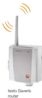
testo Saveris router