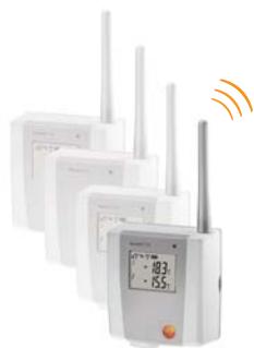
testo Saveris draadloze voeler